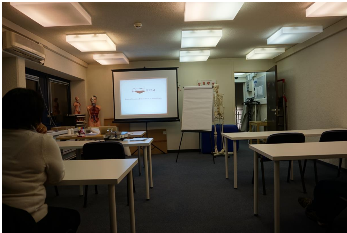
La salle de théorie – Avouillons 12 à Gland